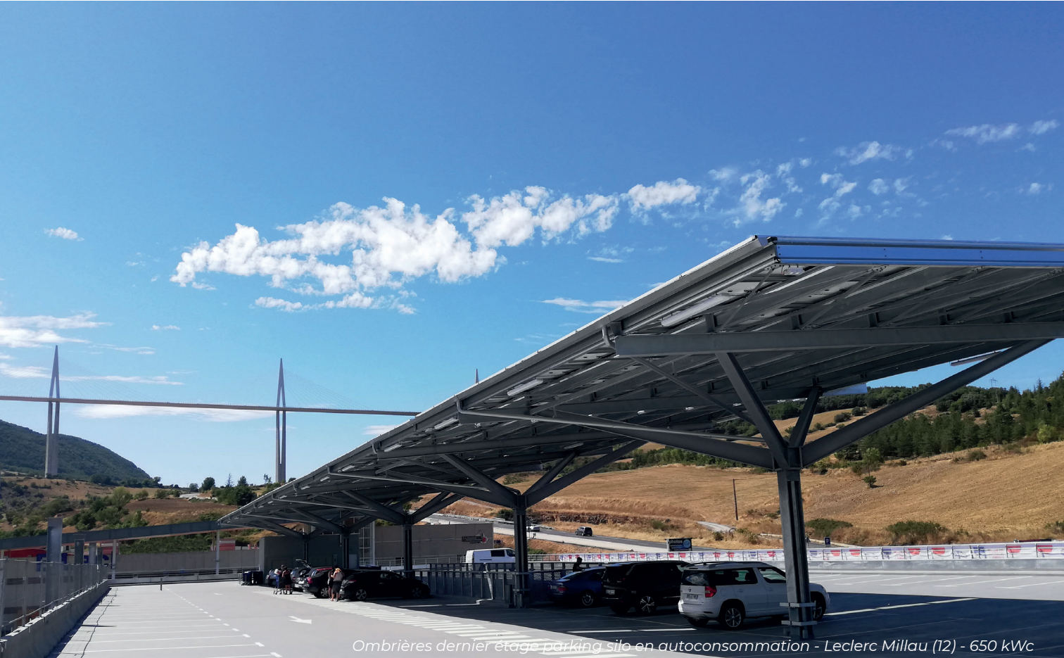
Ombrières dernier étage parking silo en autoconsommation - Leclerc Millau (12) - 650 kWc

Équipez-vous d'une centrale solaire ET ECONOMISEZ SUR VOS FACTURES