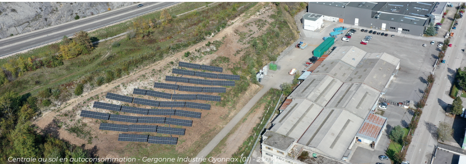
Centrale au sol en autoconsommation - Gergonne Industrie Oyonnax (01) - 250 kWc