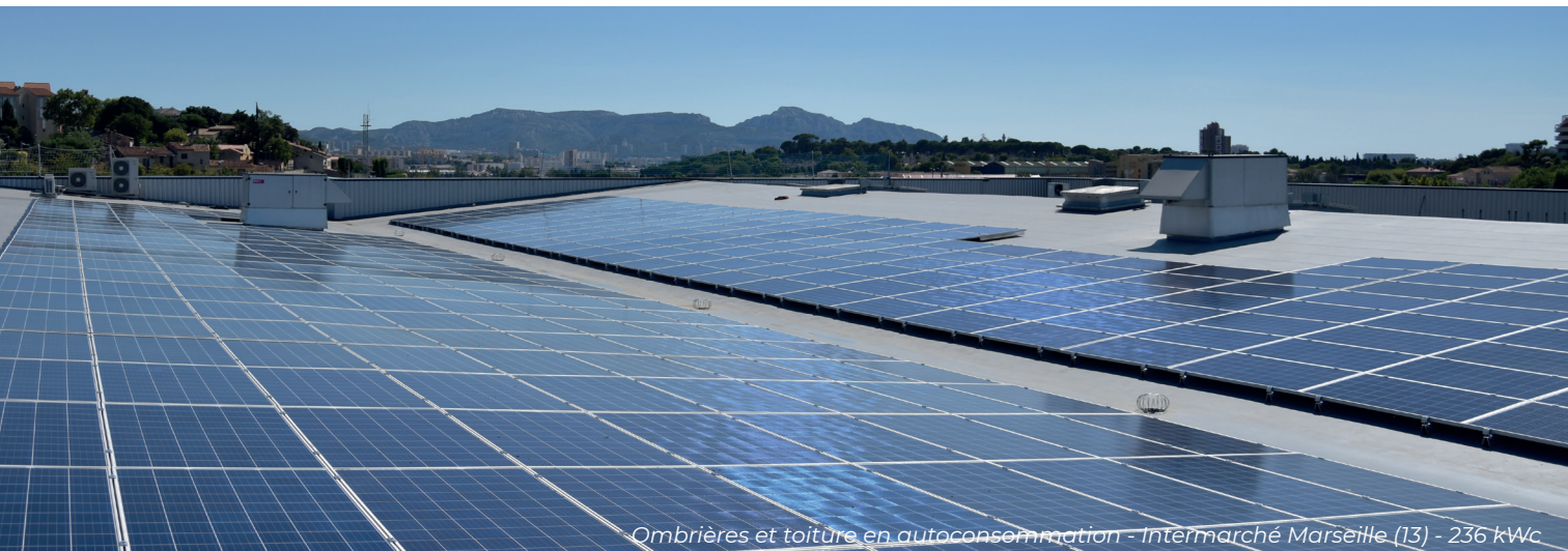
Ombrières et toiture en autoconsommation - Intermarché Marseille (13) - 236 kWc